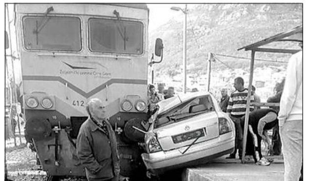
(НЕ)СРЕЋА Воз вукао возило десетак метара

СУДАР ВОЗА И АУТА НА ПРУЖНОМ ПРЕЛАЗУ У БАРУ