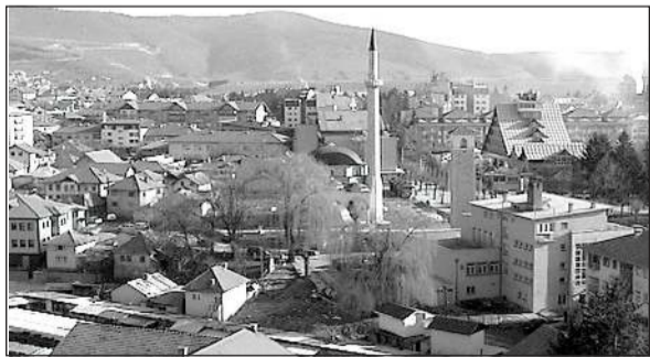
СТАТИСТИКА Број пензионера на крају 2015. године повећан на 6.490

Послодавци због тога, али и све већих намета, нису у могућности да дају плате веће од 200 евра. У већини случајева зараде у угоститељству или мањим трговачким радњама су испод те суме.