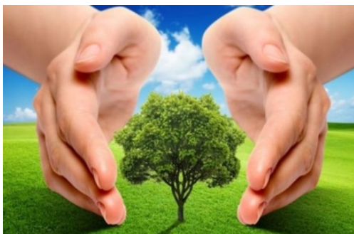
Koalicija će pratiti i analizirati pregovore

Inicijatori Koalicije 27 su Grin Houm /Green Home/, Centar za zaštitu i proučavanje ptica, Društvo mladih ekologa i Sjeverna zemlja, a u njoj su i Ekspedito /Expedito/, Da zaživi selo, Program za životnu sredinu, Zeleni Crne Gore, Mreža za afirmaciju nevladinog sektora /MANS/, Regionalna Razvojna Agencija za Bjelasicu, Komove i Prokletije, Centar za razvoj Durmitora,