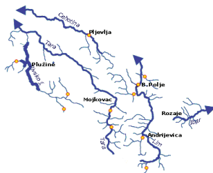
Crnomorski sliv Crne Gore

Svi vodni resursi Crne Gore pripadaju Crnomorskom i Jadranskom slivu. Opštine Andrijevica, Berane, Gusinje i Rožaje pripadaju Crnomorskom slivu.